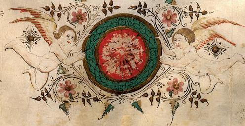
Tav. 7. Maestro di Isabella di Chiaromonte, Frontespizio. Descriptio Terrae Sanctae. Napoli, Biblioteca Nazionale "Vittorio Emanuele III", ms ex-Vind. Lat. 49, c. 1(ter)r.

V MINVETE ridus hystorius legamus si cut dicit beatus iheronymus quosdam lustrasse prouiti as maria transficasse: ut ea qua ex libris nouerant coram posita uiderent: ut plato menphiticos uates/ & egiptiu appollonius qui per sas intrauit. transiuit caucasum/ albanos/ sitas/ massageras/ indiam/ bragmannos quoq; ut hyar cham uiderent. & tandem egiptum intrauit/ ut famofam mensam solis uideret in sabulo. Quid mirum si christiani terram illam quam christi sonant ecclesie uniuersae uidere & uisitare desi derant. Venerabantur antiqui sancta sanctorum quia ibi erat archa testamenti/ & cherubin cum propiciatorio/ & manna/ & uirga aaron qua fron