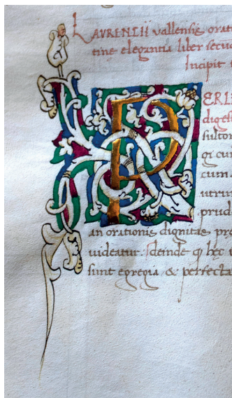
Tav. 5 b. Maestro di Isabella di Chiaromonte, Iniziale incipitaria . L. Valla, Elegantiarum latinae linguae , III. Napoli, Biblioteca Nazionale "Vittorio Emanuele III", ms V.D.57, c. 68r.